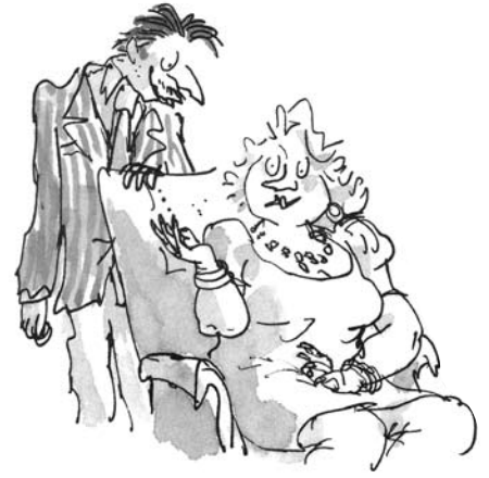
瑪蒂達的父母 溫伍德夫婦